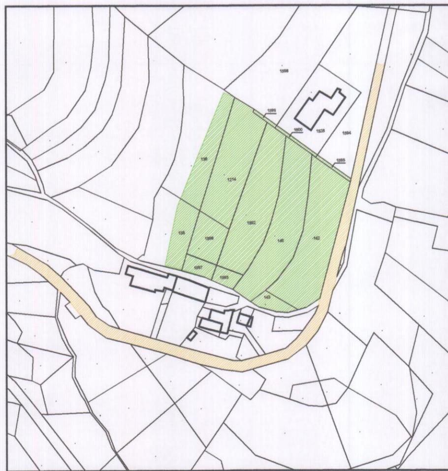
ESTRATTO CATASTALE - Scala 1: 2000 FOGLIO 21 - M.N. 140-142-143-1592-1593 FOGLIO 21 - M.N. 1214-1596-1597-135-136 FOGLIO 21 - M.N. 1595-1599-1600